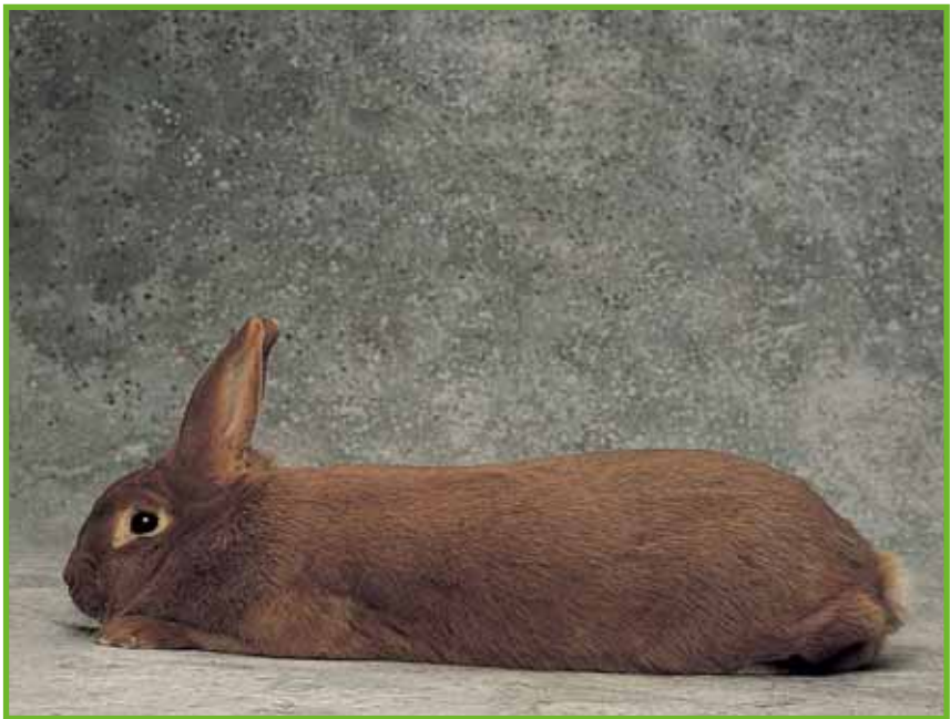
ROSSA DELLA NUOVA ZELANDA (femmina)