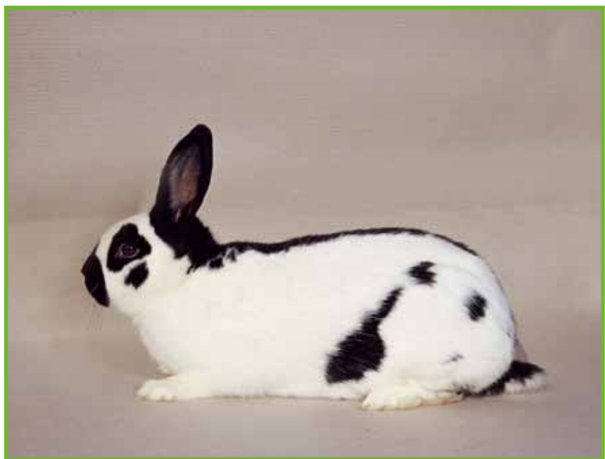
PEZZATA PICCOLA (maschio)